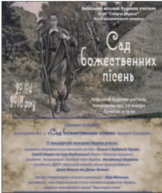
На сцені Київського міського будинку вчителя, 20 квітня 2016 р.