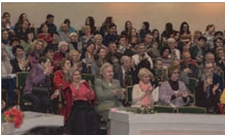
Фрагмент глядацького залу Київського міського будинку вчителя. Вечір «Сад божественних пісень», 20 квітня 2016 р.

Ось його лист до свого учня Михайла Ковалінського: «Найдорожчий друже Михайле! Дехто, як каже Сократ, живе, щоб їсти й пити, я ж навпаки – їм, щоб жити. Хоч більшість зовсім не знає, що значить жити, об'їдаються м'ясом і обпиваються різними хмільними напоями. Тому найважче мистецтво – навчитися жити... Ми уникаємо хворих тілом, щоб вони не могли нас заразити різними хворобами, але охоче підтримуємо